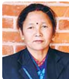
श्री सुनु श्रेष्ठ उपस्वास्थ्य चौकी जयखानी, गुल्मी

मलाई छोडी मेलामा जाँदा आमा आँखा विग्रे सागसब्जी नखाँदा पानी लिनलाई आउँ स्वास्थ्य चौकीमा सल्लाह लिनलाई